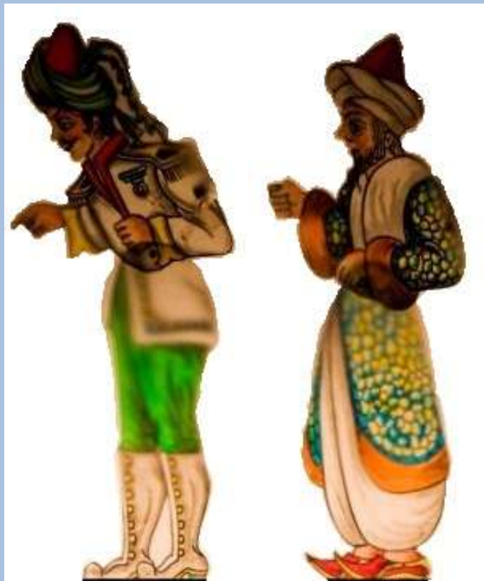
Αξιωματικός και πασάς (εργαλεία Ηλία Καρελλά)