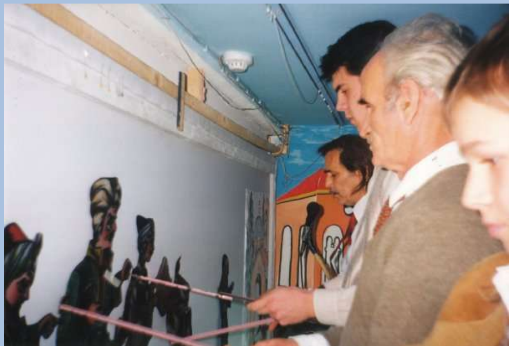
Πίσω από την σκηνή, στο θέατρο στο Λουτράκι.