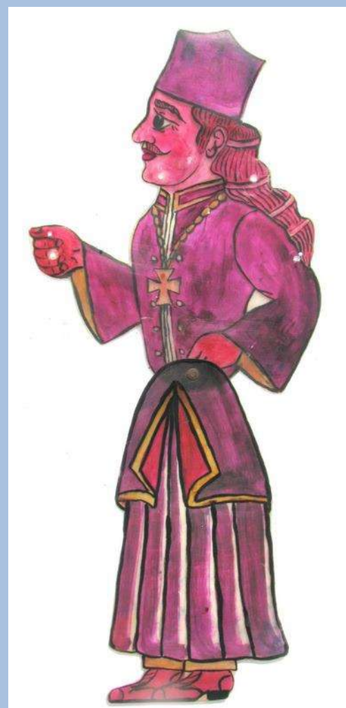
Καλόγερος, εργαλείο Κώσταρου και μετέπειτα Γιάνναρου