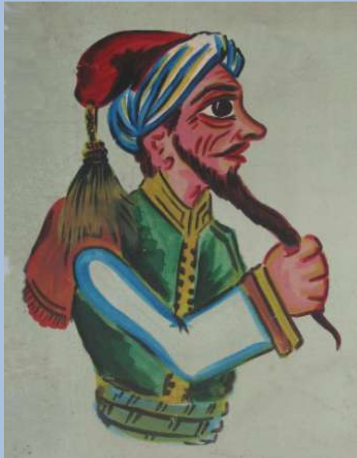
Τοιχογραφία στο εργαστήρι του Γιάνναρου