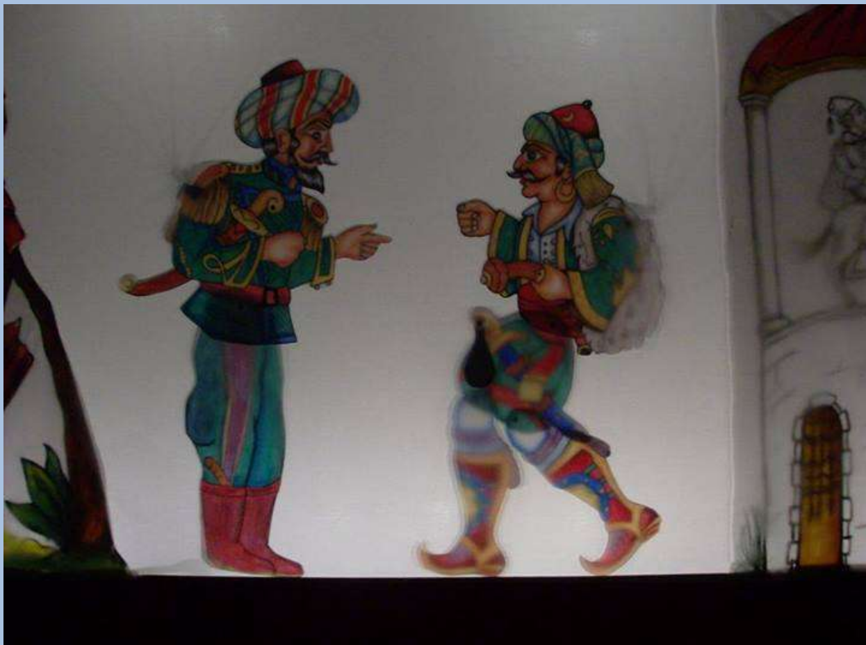
Πασάς και Βεληγκέκας (Φιγούρες 2009)