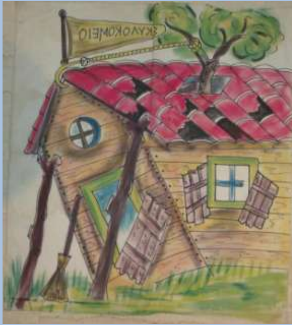
Παράγκα Φώτη Πλέσσα

Έχει ασχοληθεί με την κατασκευή σκηνικών σε πανί. Επίσης χρησιμοποιεί και σκηνικά του πατέρα του, του Φώτη Πλέσσα και του Νικόλα Τζιβελέκη.