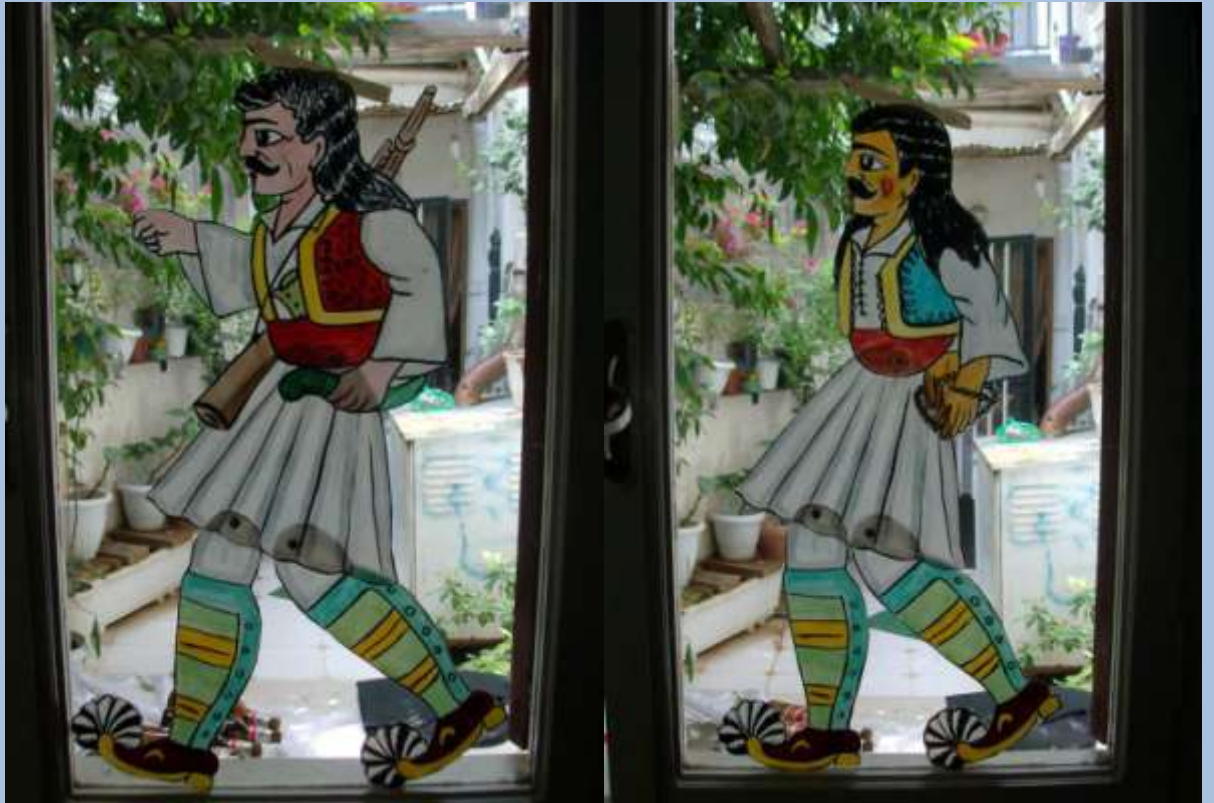
Ο Αθανάσιος Διάκος πολεμιστής (αριστερά) και δέσμιος (δεξιά). (Φιγούρες δεκαετίας 1990)