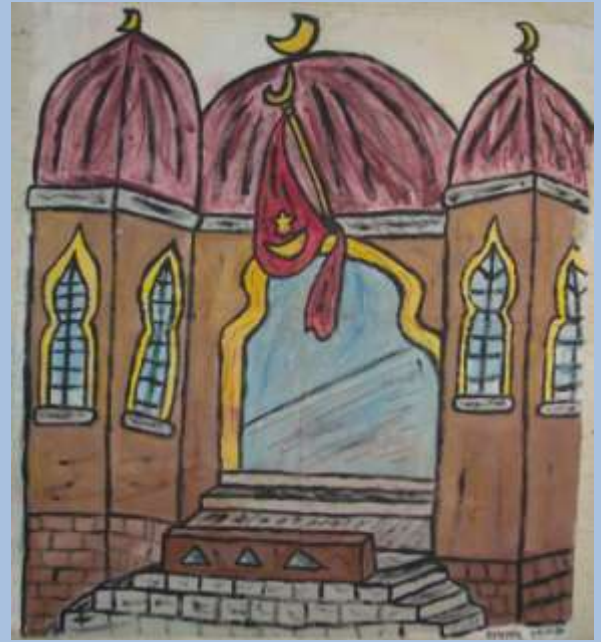
Σαράι Αυγέρη Μπαλούρδου (1989)