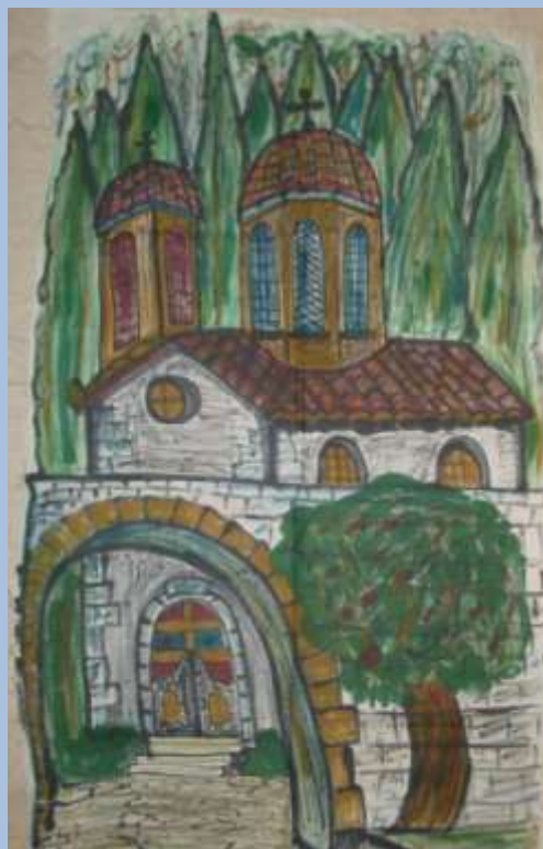
Μοναστήρι Αυγέρη Μπαλούρδου