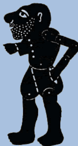
ο Καραγκιόζης του Μίμαρου