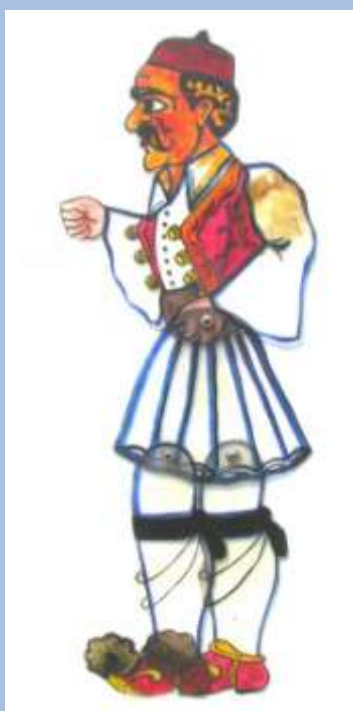
Βλάχος Φώτη Πλέσσα