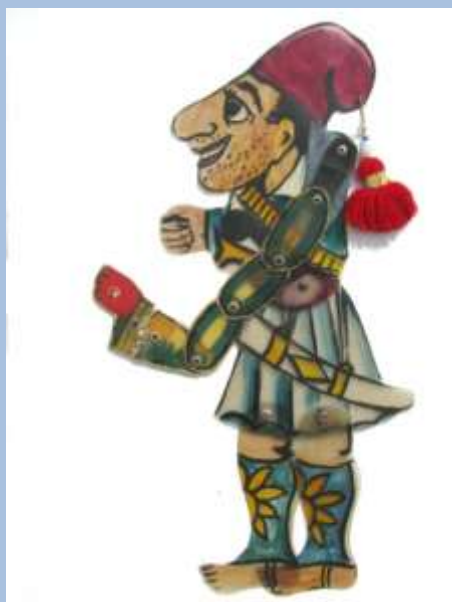
Καραγκιόζης κλέφτης του Αβραάμ