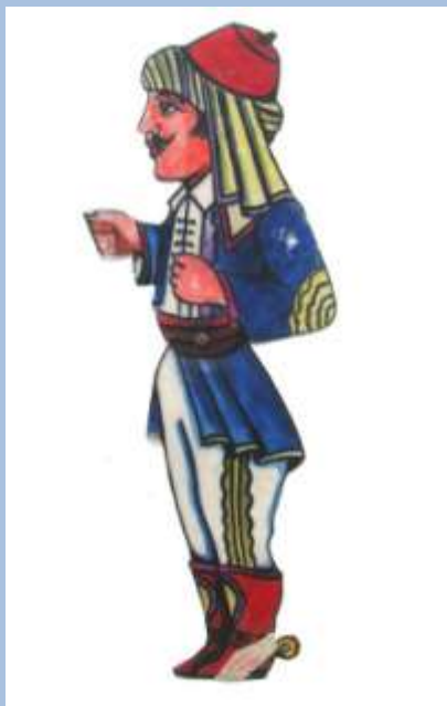
Αξιωματικός του Αβραάμ