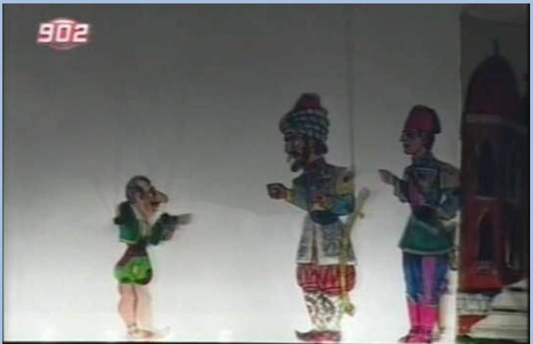
Στιγμιότυπο από την παράσταση «Η αρπαγή από το χαρέμι», στο φεστιβάλ «Σπαθάρεια» του 2000.