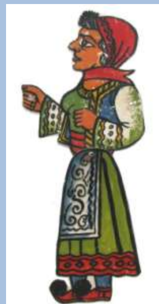
Βλάχα Σωτήρη Ασπιώτη