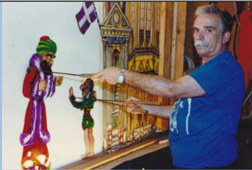
Στα γυρίσματα της παράστασης «Η κρεμάλα του Πατριάρχη», για την τηλεοπτική σειρά «Και μιλάει... και λαλάει»