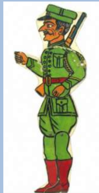
Χωροφύλακας Σωτήρη Ασπιώτη