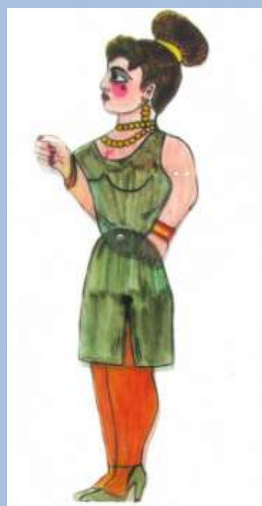
Κοπέλα Φώτη Πλέσσα