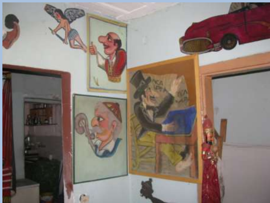
Στο εργαστήρι του Γιάνναρου.