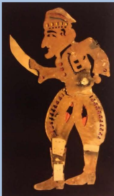
Τούρκος, Μουσείο Λαϊκής Τέχνης, Κύπρος

Οι φιγούρες που κατασκεύαζε ήταν κυρίως από χαρτόνι και μερικές δερμάτινες.