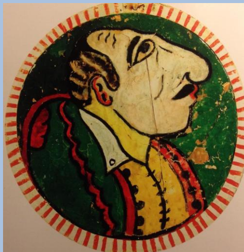
Καραγκιόζης, διακοσμητικό πορτρέτο της σκηνής του, Μουσείο Λαϊκής Τέχνης, Κύπρος