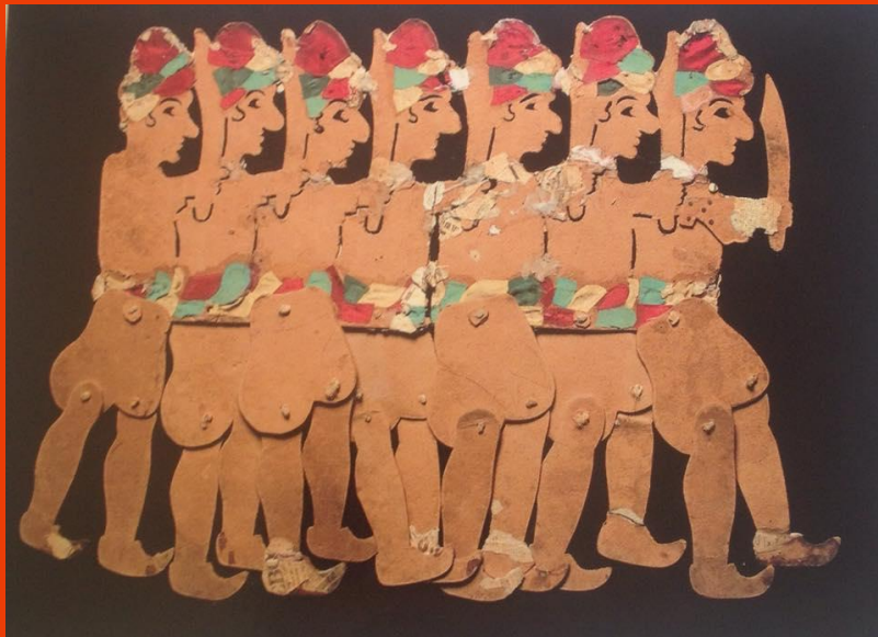
Φιγούρες του Χριστοδούλου Πάφιου