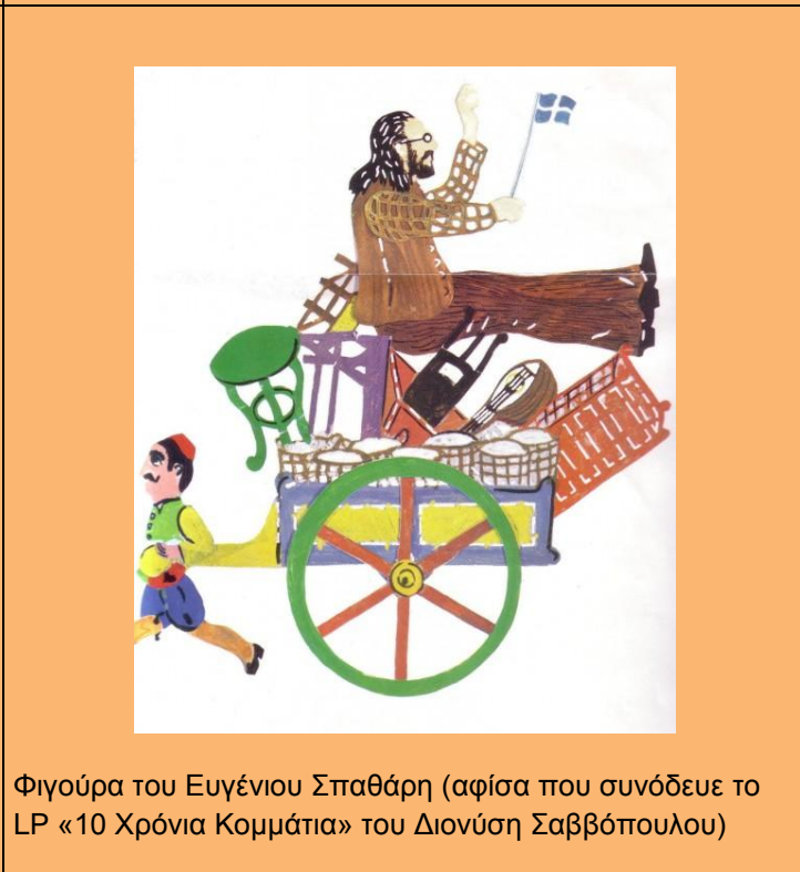
Φιγούρα του Ευγένιου Σπαθάρη (αφίσα που συνόδευε το LP «10 Χρόνια Κομμάτια» του Διονύση Σαββόπουλου)